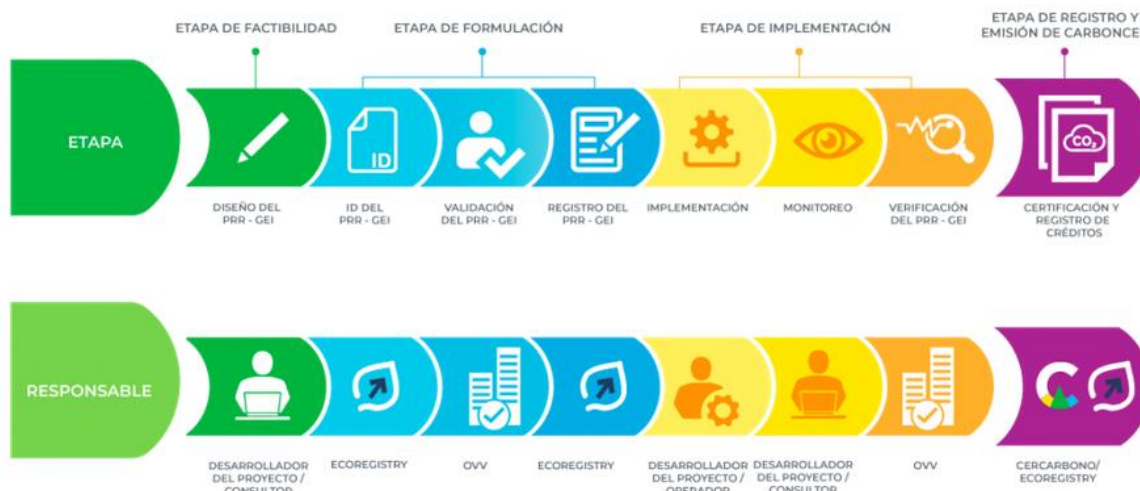
Figura 3. Ciclo de proyecto bajo CERCARBONO

En el contexto de CERCARBONO, el ciclo de proyecto requerido para que un PRR-GEI pueda ser registrado y pueda generar CARBONCER está compuesto por ocho fases: